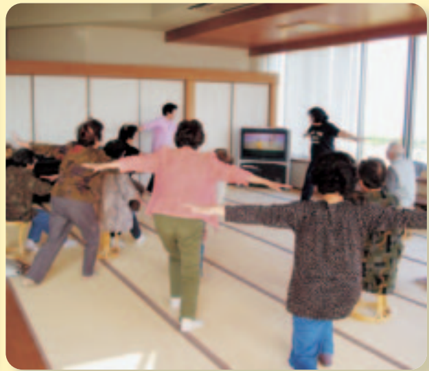
▲鷹島支所でのサロン風景