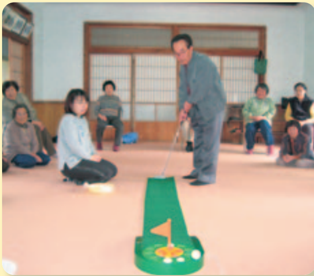
▲松浦本所でのサロン風景

編集・発行／社会福祉法人 松浦市社会福祉協議会 松浦市志佐町浦免871番地 電話(0956)72-0788 FAX 72-0649 E-mail:matsuura@fukushi-net.or.jp